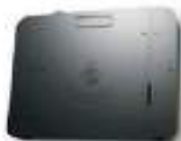
The hardware box